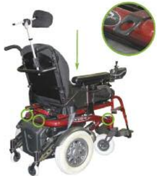
quatre (4) points d'ancrage