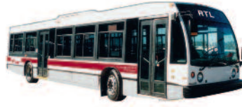
Nova LFS depuis 1997