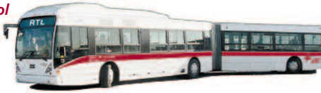
Van Hool AG300 depuis 2002

n.m. Au plan technique, c'est l'ensemble des véhicules d'une entreprise. Parc d'autobus d'un organisme de transport. Le parc du RTL comprend plus de 400 autobus de différents modèles: conventionnel , à plancher surbaissé et articulé . (À éviter: flotte d'autobus; ce terme s'applique aux navires et aux avions.)