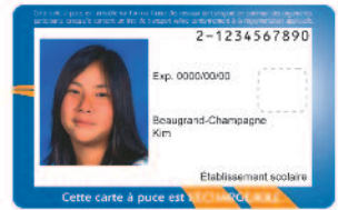
verso d'une carte OPUS à tarif réduit

n.m. Montant à acquitter pour être admis à bord des véhicules de transport collectif. Il existe des tarifs ordinaire et réduit.