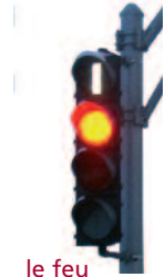
le feu "cigarette"

expr. f. De plus en plus utilisée pour désigner un ensemble de dispositifs qui visent à favoriser le transport collectif. Par exemple: les voies réservées aux autobus, la synchronisation des feux de circulation, la signalisation et le marquage au sol constituent des mesures préférentielles.