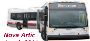
Nova Artic depuis 2011