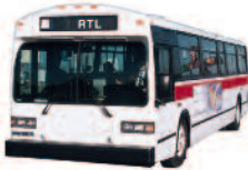
Classic depuis 1983