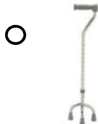
CANNE TRIPODE OU QUADRIPODE